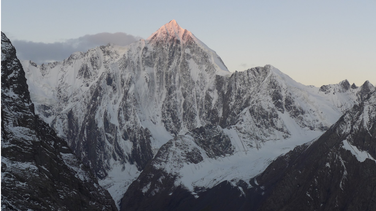
Abbildung 12: Die NO-Wand des Pik Piramidalny unmittelbar nach der Schlechtwetterphase.

die Couloirs ihren Weg hinabgebahnt hatten. Auf den Eisfeldern in der Wand konnten wir mit dem Fernglas die Einschlaglöcher großer Felsstücke ausmachen. Jetzt ist unser Ziel weiß verschneit, keinerlei Steinschlag ist erkennbar und die Couloirs versprechen ausgezeichnete Eiskletterei. Schnell ist der Entschluss gefallen, dass wir die Wand doch noch versuchen werden. Mithilfe des Fernglases einigen wir uns auf eine Linie rechts des zentralen Felspfeilers, den die Russen im Jahr 1989 erstgegangen haben. Auf einer Plane breiten wir die Ausrüstung aus und entscheiden, was wir mitnehmen werden. Wir rechnen mit vier bis fünf Tagen, bis wir wieder im Basislager sind.