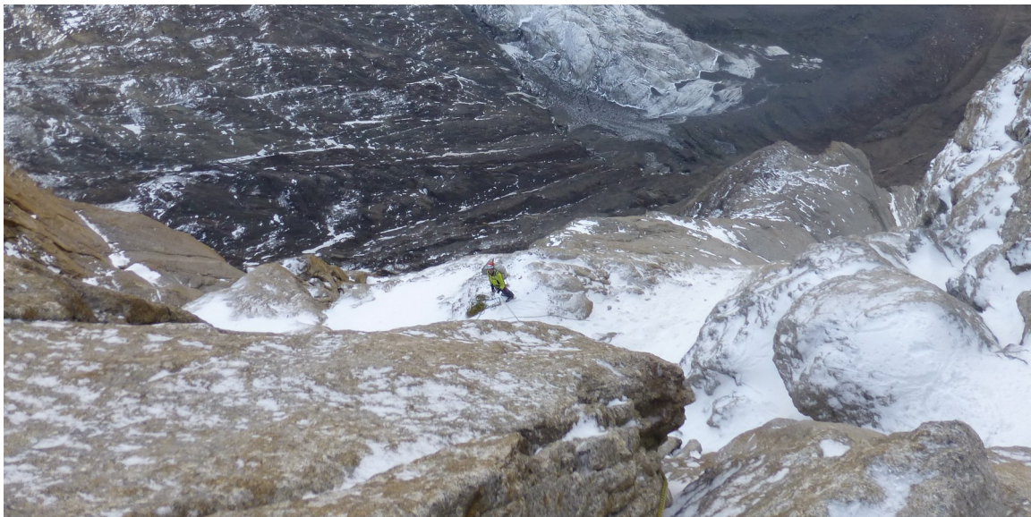
Abbildung 11: Kontrastprogramm drei Tage später: statt Sonne gibt's Neuschnee und Eis.