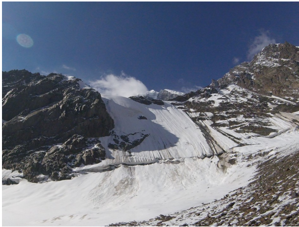
Abbildung 14: Die kurze Eiswand, die es im Zustieg zu überwinden gilt.