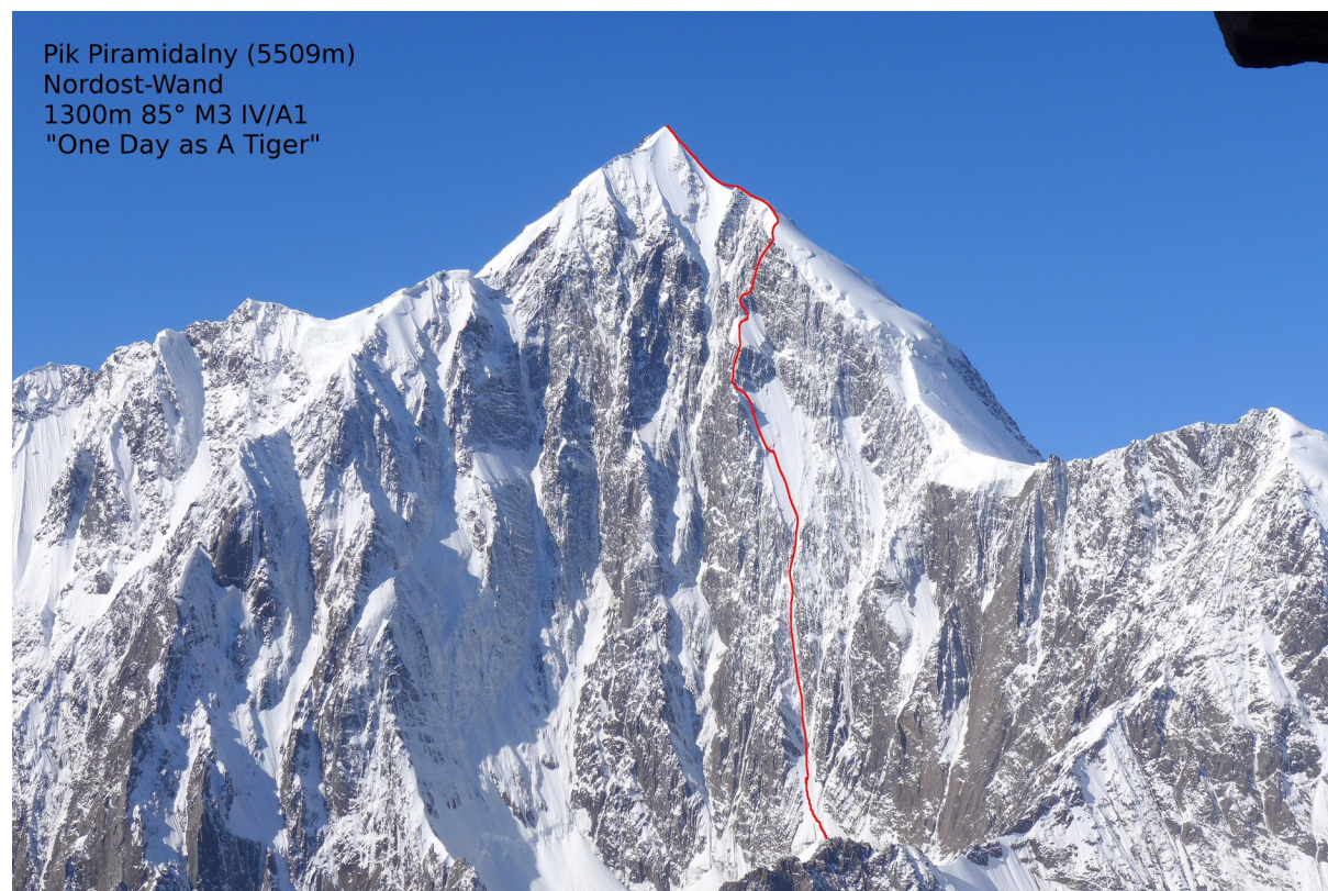
Abbildung 13: Die NO-Wand des Pik Piramidalny mit der von uns gekletterten Linie.

In Anlehnung an die unlängst erschienene Biographie des englischen Spitzenalpinisten Alex MacIntyre nennen wir unsere Erstbegehung "One Day as A Tiger". Alex war in den späten 70er und frühen 80er Jahren des vorigen Jahrhunderts einer der ersten Alpinisten, der den Alpinstil auf die hohen Wände im Himalaya übertragen hat. Seine Visionen waren Wegbereiter für den Stil, in dem auch wir am Pik Piramidalny unterwegs waren.