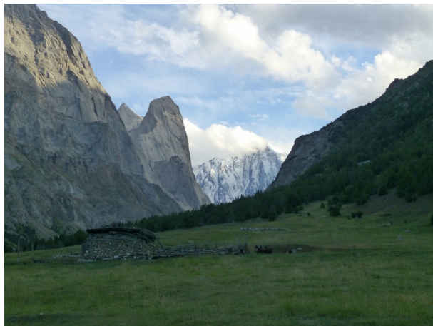
Abbildung 3: Erster Blick ins Kara-Su-Tal. Links Asan und hinten Pik Piramidalny.