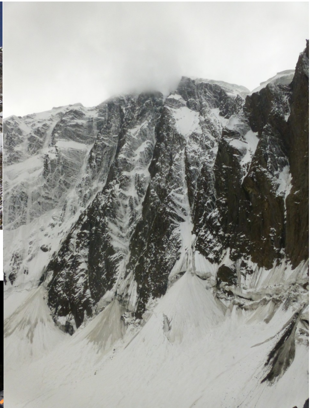
Abbildung 15: Erste Blicke in die Wand beim Abseilen ins Gletscherbecken zum Biwak 1.