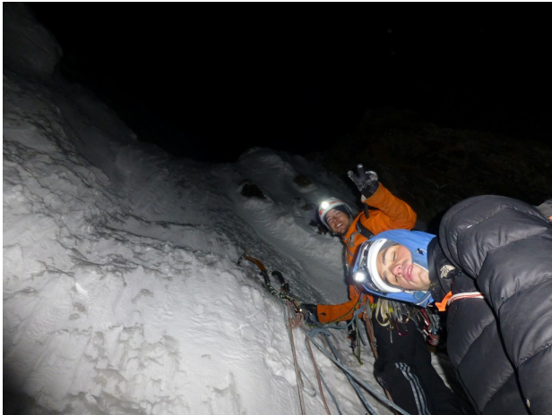
Abbildung 16: Am Beginn des aufsteilenden Couloirs an Tag 1.