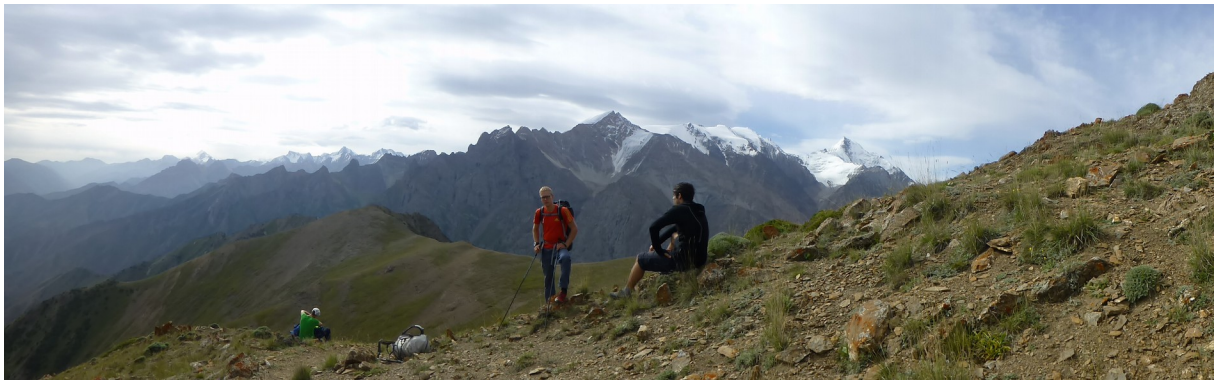
Abbildung 2: Auf dem Weg ins Basislager.