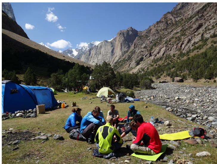
Abbildung 21: Im Basislager mit unseren österreichischen Zeltneighbarn.

24.08.2016 und 25.08.2016 Die beiden letzten Tage im Basislager verbringen wir überwiegend auf unseren Isomatten in der Sonne und im Essenzelt vor gut gefüllten Tellern. Außerdem stehen Programmpunkte wie Körperhygiene, Wäschewaschen und Schafkopfen auf der Tagesordnung.