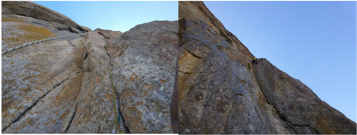
Abbildung 7: Eine der wenigen guten Seillängen an Tag 2 in der Gorbenko.