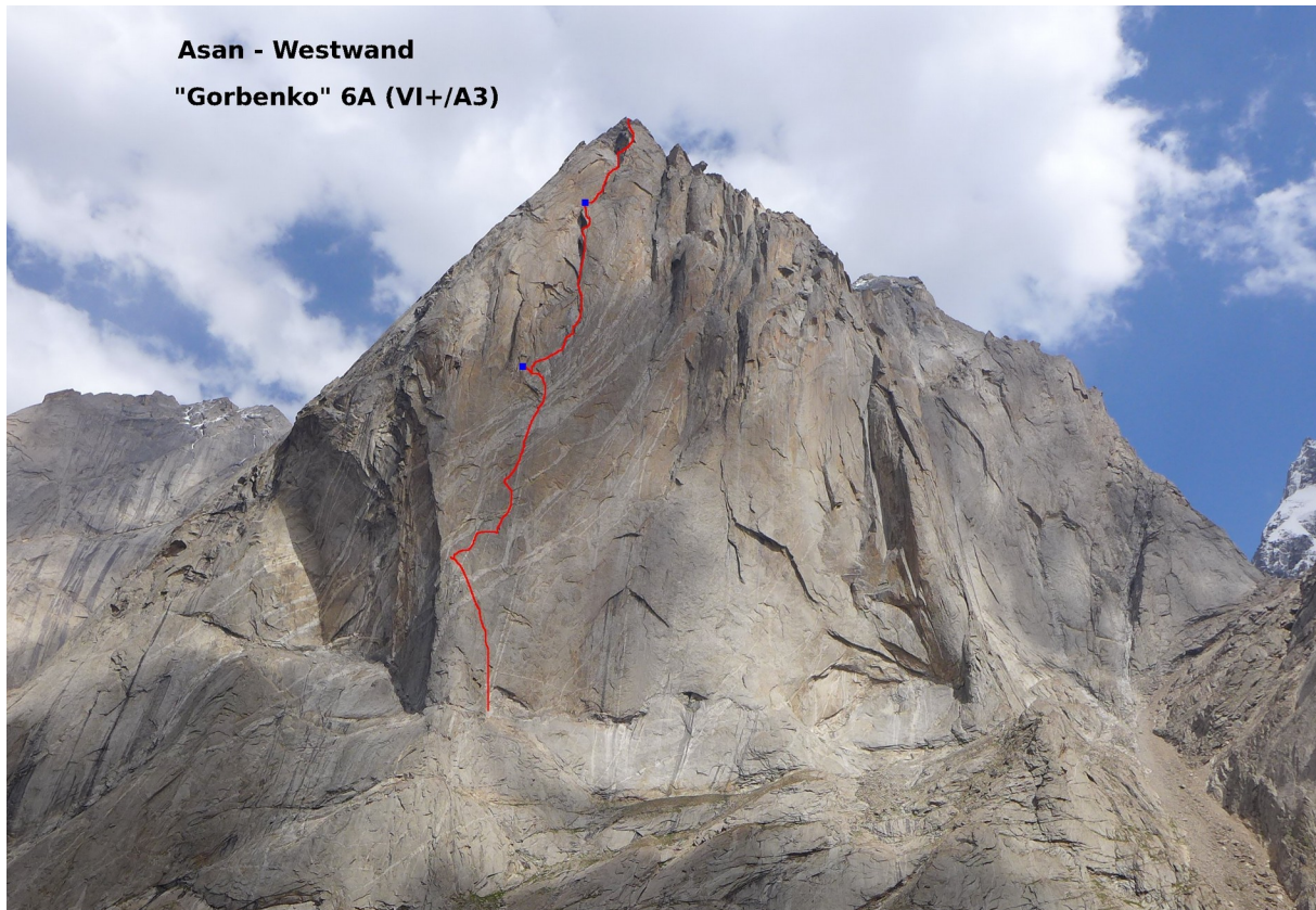
Abbildung 5: Die 800 m hohe Westwand des Asan mit der Gorbenko-Route (in blau die beiden Biwakplätze).

04.08.2016 Durch die teilweise vereisten Austiegsverschneidungen geht es für Chris und Bene an Tag drei zum Gipfel des Asan, den sie um 11:00 Uhr erreichen. Über die Abseilpiste der Nordseite gelangen sie zurück ins Tal und ins Basislager. Christian und Martin klettern die "Für einen Freund" (6a+) am Vnuk, einem dem Asan vorgelagerten Gipfel mit rund 3600 Metern. Die Route führt in zwölf Seillängen entlang des Nordwestgrates zum Gipfel, von wo es in einigen weiteren Längen zur Abseilstelle geht.