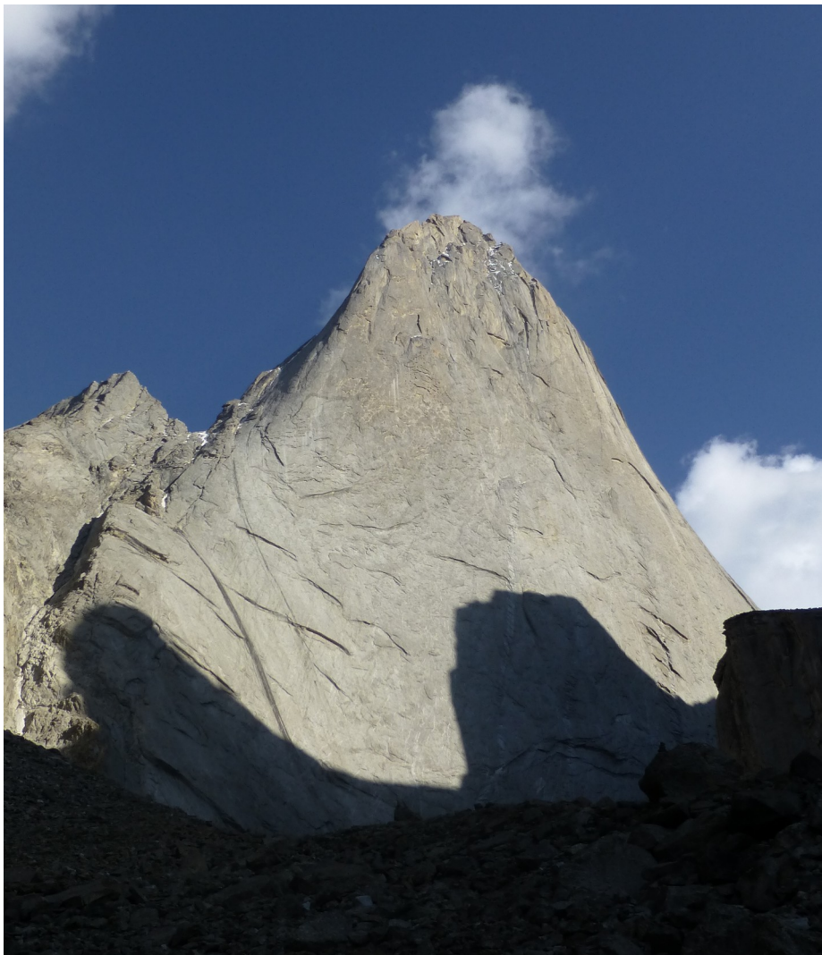
Abbildung 9: Der Odessa mit seiner 1300 m hohen NW-Wand. Die Ovtcharenko verläuft etwa am rechten Pfeiler. Die Worolewa nutzt die Quarzader im rechten Wandteil.

Christian und Martin bauen um fünf Uhr früh ihr Zelt ab und klettern die ersten Meter des Grates. Auch wir sehen die eindrucksvollen Gewitterwolken, die wenige Kilometer westlich entstehen. Nachdem wir keinerlei Informationen über die klettertechnischen Schwierigkeiten des Grates haben und uns dieser im Falle eines Gewitters keinerlei Schutz bieten würde, beschließen wir, die Überschreitung nicht durchzuführen. Entlang der Aufstiegsspur passieren wir den Gletscher, dessen Oberfläche in den Morgenstunden noch hart gefroren ist, und treffen nach 4,5-stündigem Abstieg im Basislager ein.