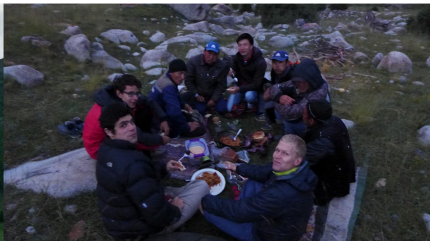
Abbildung 4: Abendessen mit den Eseltreibern