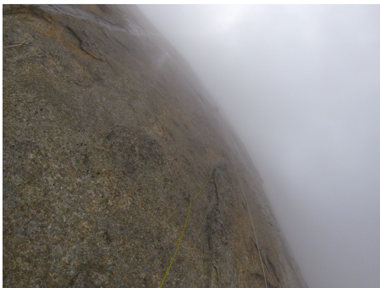
Abbildung 6: Der Highpoint beim ersten Versuch. Schlechtes Wetter und Nebel zwingen uns zum Rückzug.