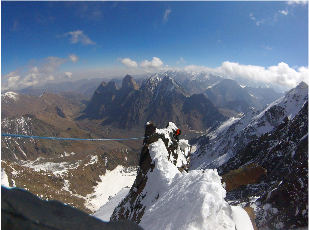
Abbildung 20: Schöne Gratkletterei vor der Headwall an Tag 2 in der Wand. Links unten sind das Col und die 150 m hohe Felswand zu erkennen, über die abgesieilt werden muss, um ins Gletscherbecken unter der Wand zu gelangen.

24.08.2016 und 25.08.2016 Die beiden letzten Tage im Basislager verbringen wir überwiegend auf unseren Isomatten in der Sonne und im Essenzelt vor gut gefüllten Tellern. Außerdem stehen Programmpunkte wie Körperhygiene, Wäschewaschen und Schafkopfen auf der Tagesordnung.