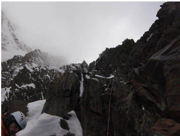
Abbildung 18: Der brüchige obere Wandteil etwa 2 Seillängen unterhalb des Ausstiegs.