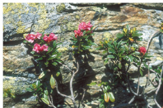
beliebtes Ziel von Botanikern und Geologen

In unmittelbarer Nähe sind einige Dreitausender , die sowohl im Winter als auch im Sommer bestiegen werden können.