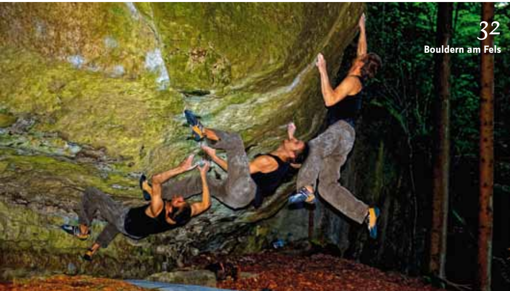
32 Bouldern am Fels