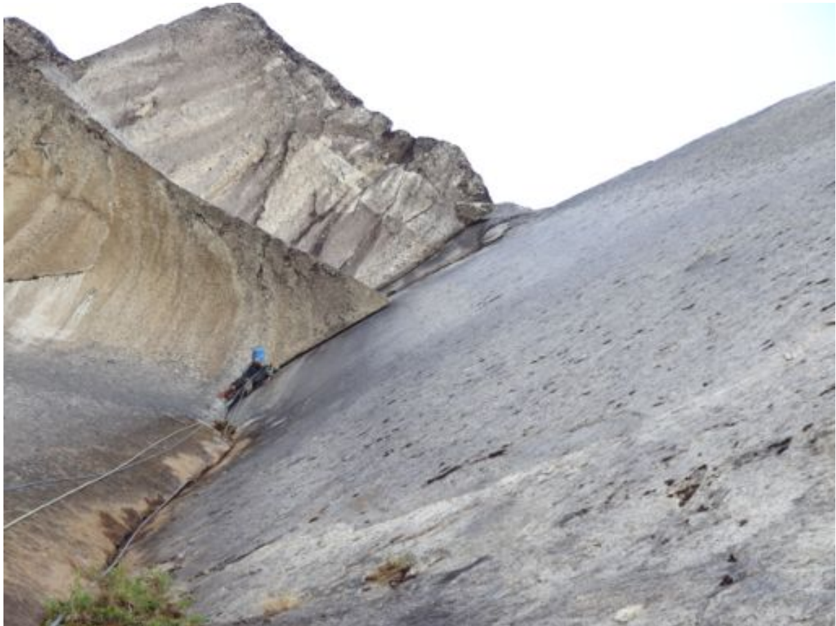
Beim Erstbegehen der 3. Seillänge

Der Abstieg erfolgt über die Route Doppler effect und hat alpinen Charakter mit mehrfach abseilen und zwischendurch immer wieder laufen über Bänder: