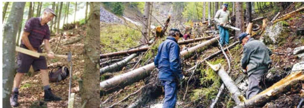
Helfer aus der Sektion Bergbund Rosenheim machen den Weg zur Mitteralm wieder begehbar.

Nachdem der Weg vom Aipl herauf inzwischen wieder freigeräumt ist, stehen jetzt die Reparaturarbeiten an. Jeden zweiten Dienstag treffen sich die Freiwilligen und kümmern sich da-