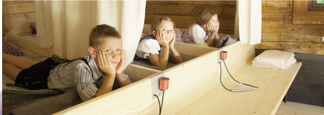
Alfons Walde. Archiv des DAV; Vase „Matterhorn“. Archiv des DAV; Kinder in der Höllentalangerhütte. Foto: Monika Bürner, 2018.