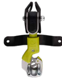
Topper Station Refit 73712