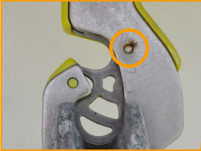
BEOBACHTEN / REGELMÄSSIGE ÜBERPRÜFUNG Punktuell einsetzende Korrosion im Bereich der Schnapperschraube.