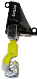
Topper Station 72014