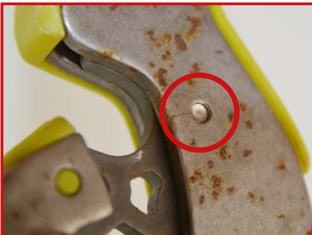
AUSTAUSCH / MELDUNG AN EDELRID Risse und Brüche, speziell im Bereich der Schnapperschraube.

Meldeformular bitte ausfüllen > Topper können unter Beobachtung weiter verwendet werden. Topper für den Außenbereich werden bei Verfügbarkeit bereitgestellt.