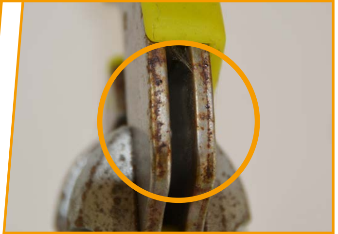
BEOBACHTEN / REGELMÄSSIGE ÜBERPRÜFUNG Starke Korrosion an den Flanschen.