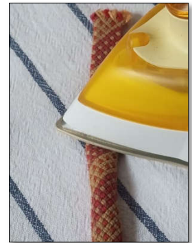
Abbildung 3: Vorbereitung - Bügeln