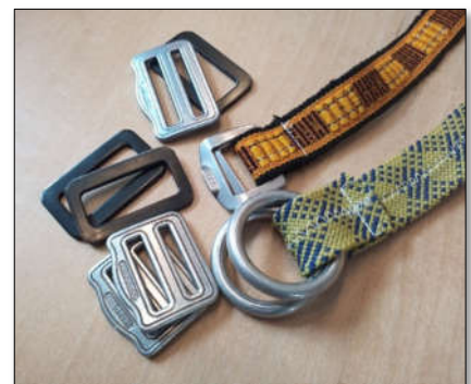
Abbildung 4: Auswahl verschiedener Gurtschnallen