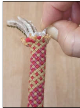
Abbildung 2: Vorbereitung - Entkernen