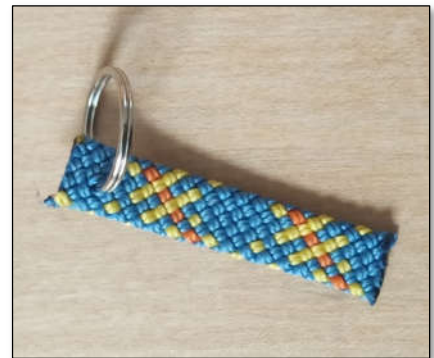
Abbildung 2: Schlüsselanhänger flach