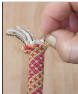
Abbildung 4: Vorbereitung - Seil entkernen