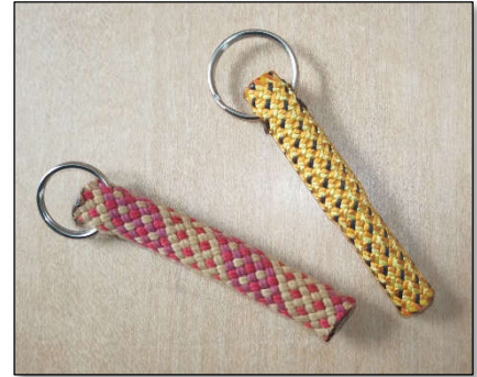
Abbildung 1: Schlüsselanhänger rund