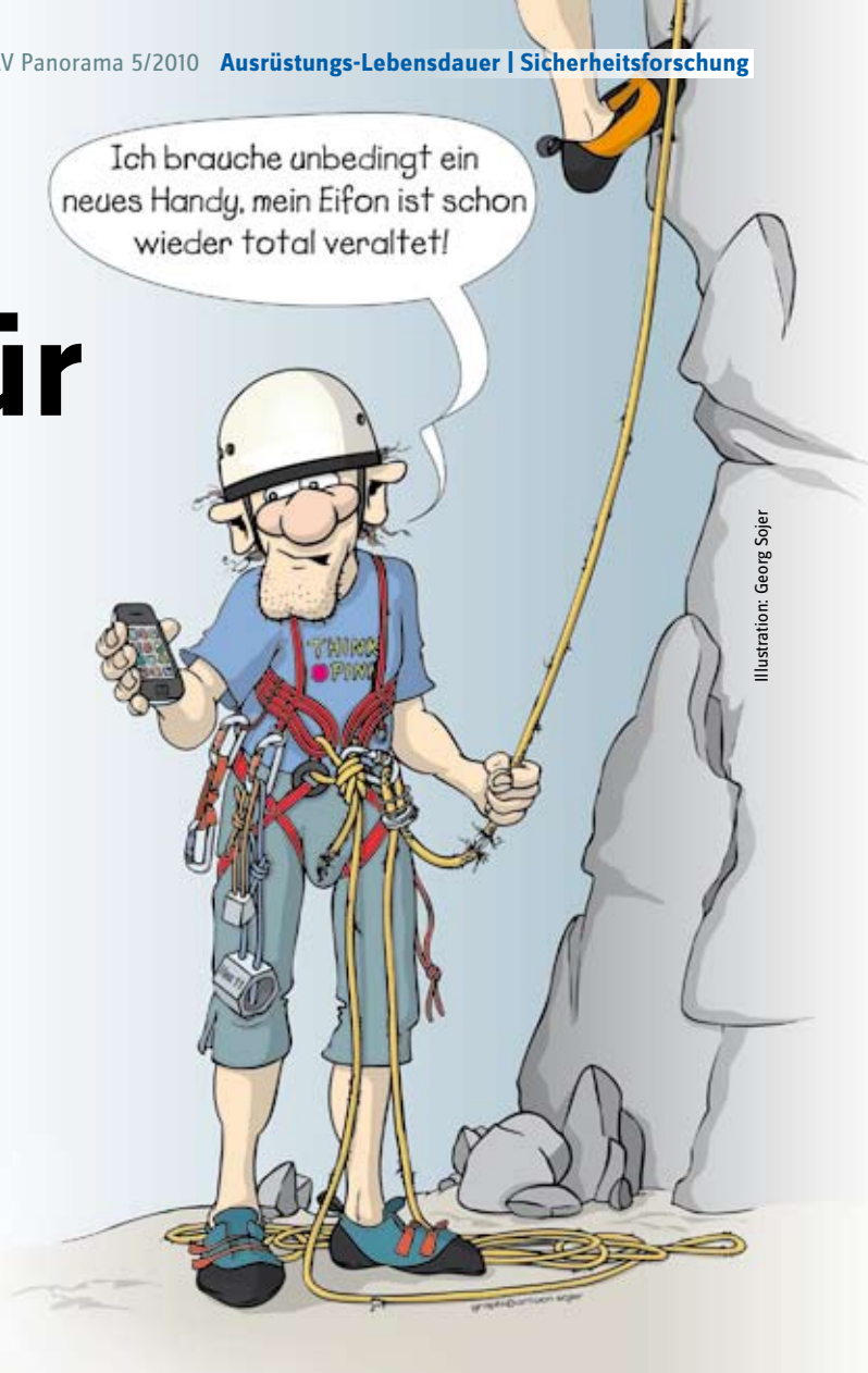
Illustration: Georg Sojer

Sicherungs-ausrüstung für den Bergsport wird in den Normen als „Persönliche Schutzausrüstung“ (PSA) bezeichnet. Dafür existieren drei Schutzklassen; Bergsportausrüstung ist meist der höchsten Schutzklasse III – gegen Absturz aus großen Höhen – zugeordnet. Auf Produkten dieser Kategorie muss ein CE-Zeichen angebracht sein, mit der Kennziffer des Prüfinstituts, das die Ausrüstung zertifiziert hat. Ein CE-Zeichen ohne Kennziffer ist eine reine Selbsterklärung des Herstellers und belegt nicht, dass der Ausrüstungsgegenstand von einer unabhängigen Stelle überprüft wurde! Die UIAA-Norm ist eine freiwillige –