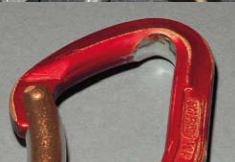
Abb. 6: Das Schleifen des Seils an Karabinern, vor allem in Hallen, kann scharfe Kanten erzeugen, die dann ihrerseits bei Sturzbelastung das Seil durchschneiden können.