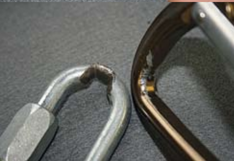
Abb. 5: Durch die Kanten von Bohrhakenplättchen können Karabiner und Schraubglieder Kerben entwickeln, die die Festigkeit reduzieren und den Seilverschleiß beschleunigen.