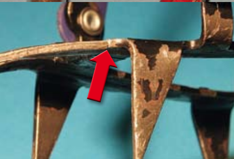
Abb. 7: Jedes Steigeisen hält die intensive Belastung nur eine begrenzte Zeit lang aus. Mit einer Lupe regelmäßig auf Haarrisse kontrollieren und rechtzeitig austauschen!