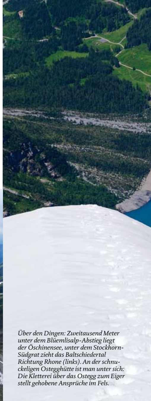
Über den Dingen: Zweitausend Meter unter dem Blüemlisalp-Abstieg liegt der Öschinensee, unter dem Stockhorn-Südgrat zieht das Baltschiederental Richtung Rhone (links). An der schnuckeligen Osteggghütte ist man unter sich: Die Kletterei über das Ostegg zum Eiger stellt gehobene Ansprüche im Fels.