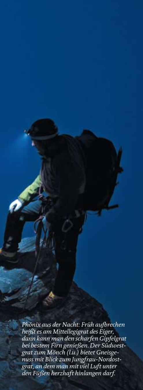
Phönix aus der Nacht: Früh aufbrechen heißt es am Mittellegigrat des Eiger, dann kann man den scharfen Gipfelgrat bei bestem Firn genießen. Der Südwestgrat zum Mönch (l.u.) bietet Gneisgenuss mit Blick zum Jungfrau-Nordostgrat, an dem man mit viel Luft unter den Füßen herzhaft hinlängen darf.

uns allein haben. Prima; französische Schnarchgeräusche klingen nämlich auch nicht eleganter als deutsche.