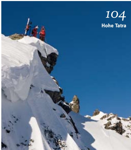
104 Hohe Tatra