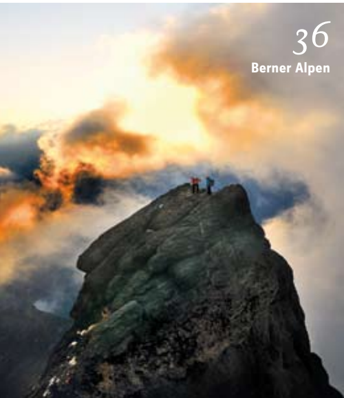
36 Berner Alpen