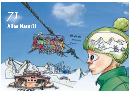
71 Alles Natur?!