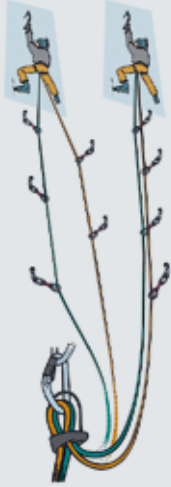
Abb. 9: Sicherung mit Halbseiltechnik, um die Seilreibung und damit die Kräfte auf die Fixpunkte zu reduzieren