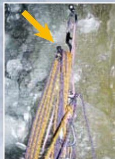
Moderne Eisschrauben bieten Sicherheit im Steileis. Der Seilhaken (Pfeil) hilft, das Seil zu organisieren.