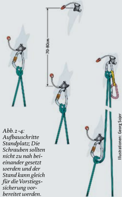
Abb. 2-4: Aufbausritte Standplatz; Die Schrauben sollten nicht zu nah beieinander gesetzt werden und der Stand kann gleich für die Vorstiegsicherung vorbereitet werden.

Als Sicherungsgerät empfiehlt sich das Tube, weil man mit ihm die Halb-