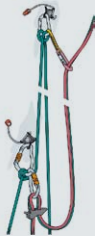
Abb. 7+8: Vorstiegssicherung mit Tube und Dummyrunner