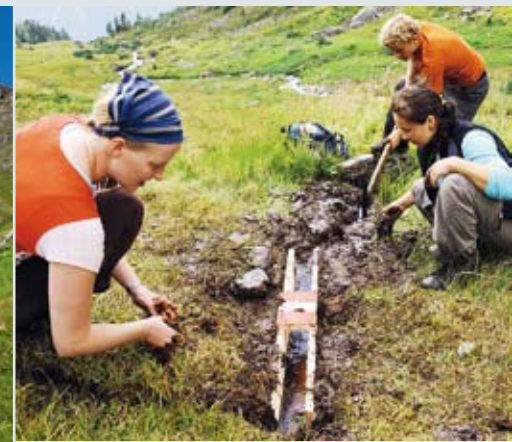
Oft stundenlang dauert der Anmarsch zum Einsatzgebiet. Drainagen halten die Wege trocken. Und nach der Arbeit schmeckt es besonders gut.