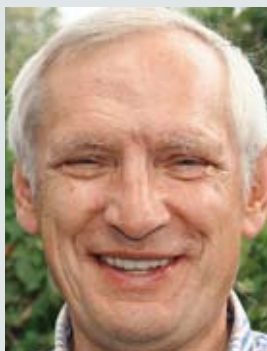
DAV-Vizepräsident Ludwig Wucherpfennig

Zu begrüßen sind Kooperationen von Sektionen wie hier von Kiel und Hamburg oder regionale Wegegemeinschaften. Sie vergrößern den Pool ehrenamtlicher Helfer, bieten die Chance zu Kooperationen mit dem örtlichen Tourismus und für eine professionelle Qualität der Alpenvereinswege. Ein wichtiger Schritt beim Thema Wege ist das gemeinsame Wegekonzept von OeAV und DAV, das die beiden Verbände in diesem Jahr verabschiedet haben. Darin wird unter anderem eine einheitliche Beschilderung geregelt, so dass Wanderer besser beurteilen können, welche Schwierigkeiten auf sie zukommen. Und die Alpenvereine werden wieder ihrer Aufgabe der Kompetenzführerschaft für alpine Wege gerecht.