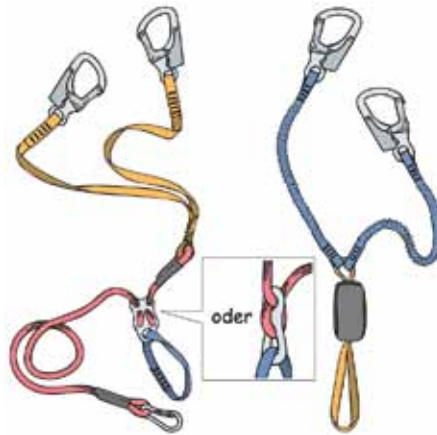
Abb. 1: Klettersteigsets mit Reibungsbremse und nicht elastischen Lastarmen sind vom Rückruf betroffen, solche mit elastischen Lastarmen und Bandfalldämpfer (rechts) waren es 2012.

Ob ein Set mit elastischen Lastarmen oder Reibungsbremse von einem Rückruf (August 2012 bzw. Februar 2013) betroffen ist, hängt von Hersteller und Modell ab und ist in der Tabelle auf Seite 68 erfasst.