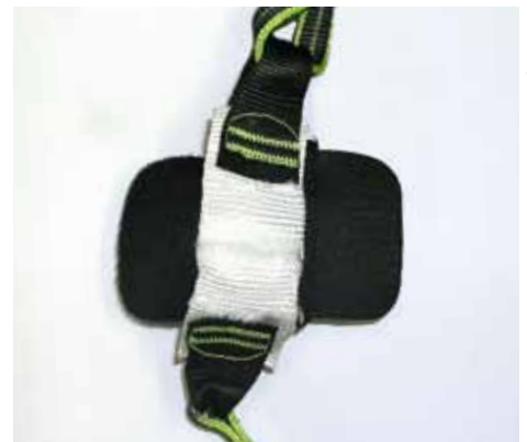
... aufgerissene Nähte bedeuten, dass das Set ausgemustert werden muss.