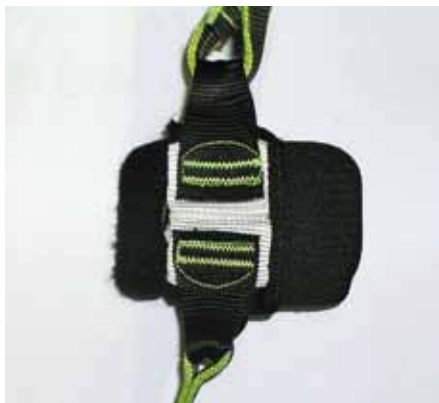
Abb. 4: Sicherheits-Check am Bandfalldämpfer: Alle Nähte müssen intakt sein ...