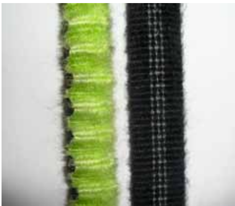
Abb. 3: Deutliches „Aufpelzen“ von textilem Material – ein Grund, das Set auszutauschern.

Für den Neukauf eines Klettersteigsets sind Bandfalldämpfer mit UIAA-Label zu empfehlen. Bandfalldämpfer haben zwei Vorteile: Erstens sind ihre Fangstoßwerte schon im Neuzustand niedriger als bei Rei-