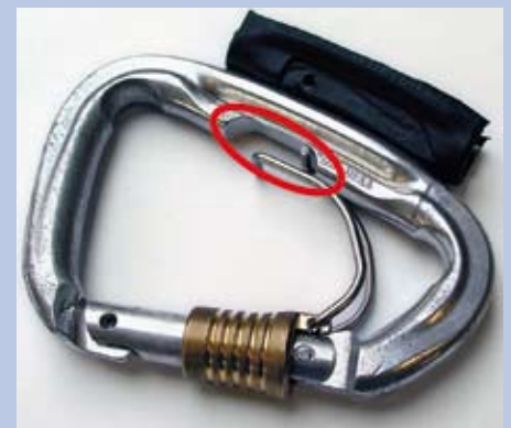
Abb. 3: Konstruktionsbedingte Schwachstelle im tragenden Karabinerschenkel