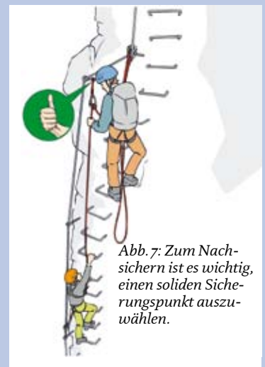
Abb. 7: Zum Nachsichern ist es wichtig, einen soliden Sicherungspunkt auszuwählen.

Illustration: Georg Sojer