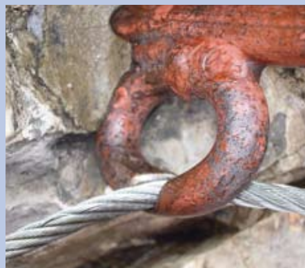
Abb. 2: Durch Zugbelastung am Drahtseil eingesägter Ösenanker