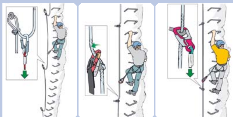
Abb. 4: Verschiedene Klettersteigsysteme: französische Bauweise; klassische Bauweise mit ungespannter und gespannter Drahtseilführung. Bei gespanntem Drahtseil ist die Biegebelastung des Karabiners maximal – ein Risiko.

■ An Klettersteigen mit stark gespannten Drahtseilen ist es besonders wichtig, immer zwei Karabiner einzuhängen, um im Sturzfall einen redundanten Karabiner in der Sicherung zu haben. Klettersteigsets in Form von V-Systemen, bei denen nur immer ein Karabiner in das Drahtseil eingehängt werden darf, sind daher nicht mehr zu empfehlen.