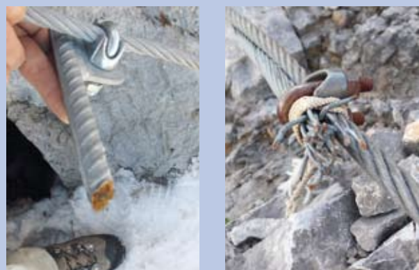
Abb. 5: Beschädigungen am Klettersteig sind beim Aufstieg von unten leider oft nicht zu erkennen.

Fotos: DAV Sicherheitsforschung, Illustrationen: Georg Sojer