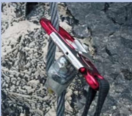
Abb. 1: Die Biegebeanspruchung von Karabinern am Klettersteiganker ist je nach Drahtseilverankerung unterschiedlich hoch.

Für Klettersteige herrscht zwar eine Verkehrswegesicherungspflicht, das heißt, der Erschließer oder Träger eines Klettersteigs muss die regelmäßige Instandhaltung sicherstellen. Bisher gibt es aber weder einen Anforderungskatalog noch eine Norm für Klettersteige, um die technische Bauart oder die Instandhaltung zu beurteilen. Da Klettersteige eine sehr lange Tradition haben, ist ein enormer Wildwuchs an unterschiedlichen Bauarten, Ankerarten und Dimensionierungen zu finden. Dies wird sich auch in näherer Zukunft nicht grundlegend ändern. Denn die von der DAV