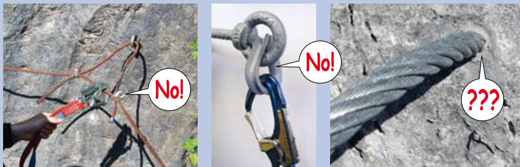
Abb. 6: Nichttragende Komponenten am Klettersteig; im linken Bild ist ein Drahtseilstück mit nur einer Seilklemme in ungünstiger Belastungsrichtung fixiert, die Konstruktion hält einem Sturz nicht stand. In der Mitte ist eine zur Seilschonung konzipierte Kausche lose im Fixpunkt eingehängt. Zudem sind die Ankerdimensionierung und der Ankerkopf ungenügend. Bei im Fels eingemörtelten Drahtseilenden (rechts) weiß man nicht, wie tief und solide die Verankerung ist: Hier nicht einhängen!