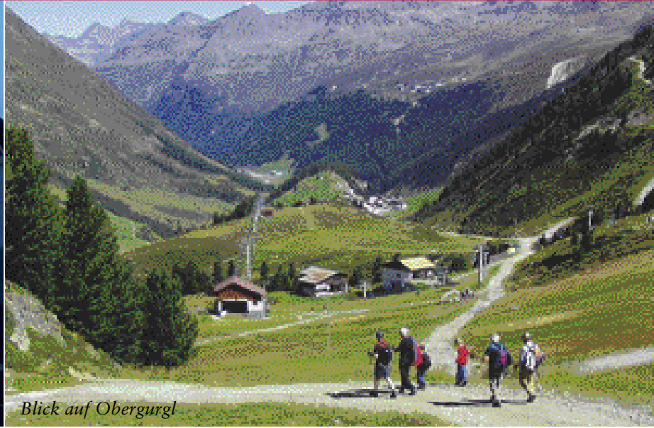
Blick auf Obergurgl

war, eine Kapelle vor der Langtalereckhütte errichtete.