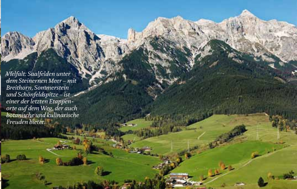
Vielfalt: Saalfelden unter dem Steinernen Meer – mit Breithorn, Sommerstein und Schönfeldspitze – ist einer der letzten Etappenorte auf dem Weg, der auch botanische und kulinarische Freuden bietet.