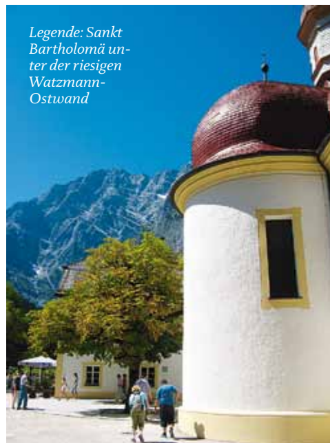
Legende: Sankt Bartholomä unter der riesigen Watzmann-Ostwand