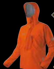
Felsturm Jacket Men

Weitere Mammut Händler finden Sie unter www.mammut.ch