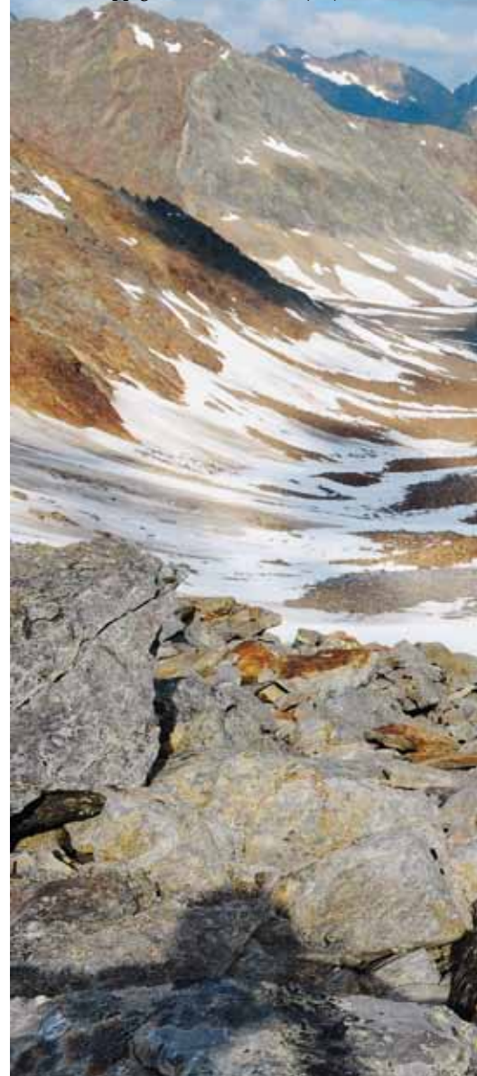
Der neue Pfaffensteig ermöglicht den schnellen Abstieg vom Zuckerhütl zur Siegerlandhütte (l.o.); beim Anstieg in die Windachscharte genießt man den Blick zurück ins Windachtal (u.) und freut sich beim Abstieg zur Timmelsalm über die üppige Flora und Fauna (r.o.).