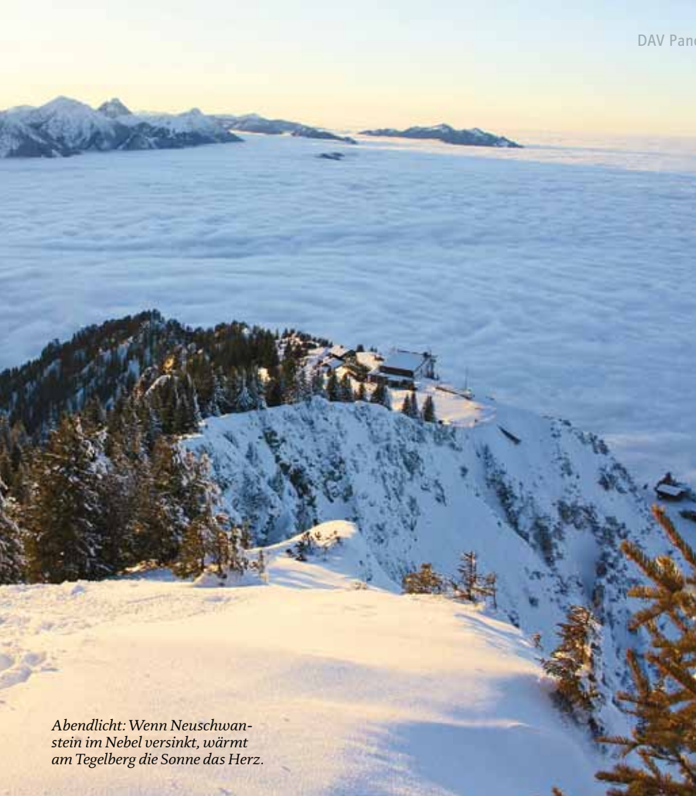
Abendlicht: Wenn Neuschwanstein im Nebel versinkt, wärmt am Tegelberg die Sonne das Herz.

auch die Skitourengeher: Den Schildern entlang steigt man am Pistenrand und auf Forstwegen zu Hausberg oder weiter zu Kreuzeck und Osterfelderkopf. Wie das künstlich geschaffene Idealbild eines Berges thront die mächtige Alpspitze bedrohlich und beschützend zugleich über dem Skigebiet. Dort hinauf zieht es nur echte Alpinisten bei besten Skitourenverhältnissen. Über den Stuibensee oder gar die Schönen Gänge mit Ski zur Alpspitze, das ist nichts für reine Pistengeher.