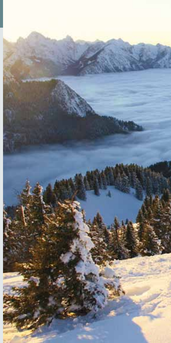
Pistenrand: Die Trennung von Aufstieg und Abfahrt nützt allen.

Fast alle Ausgangspunkte sind öffentlich erreichbar: im Osten mit der Bayerischen