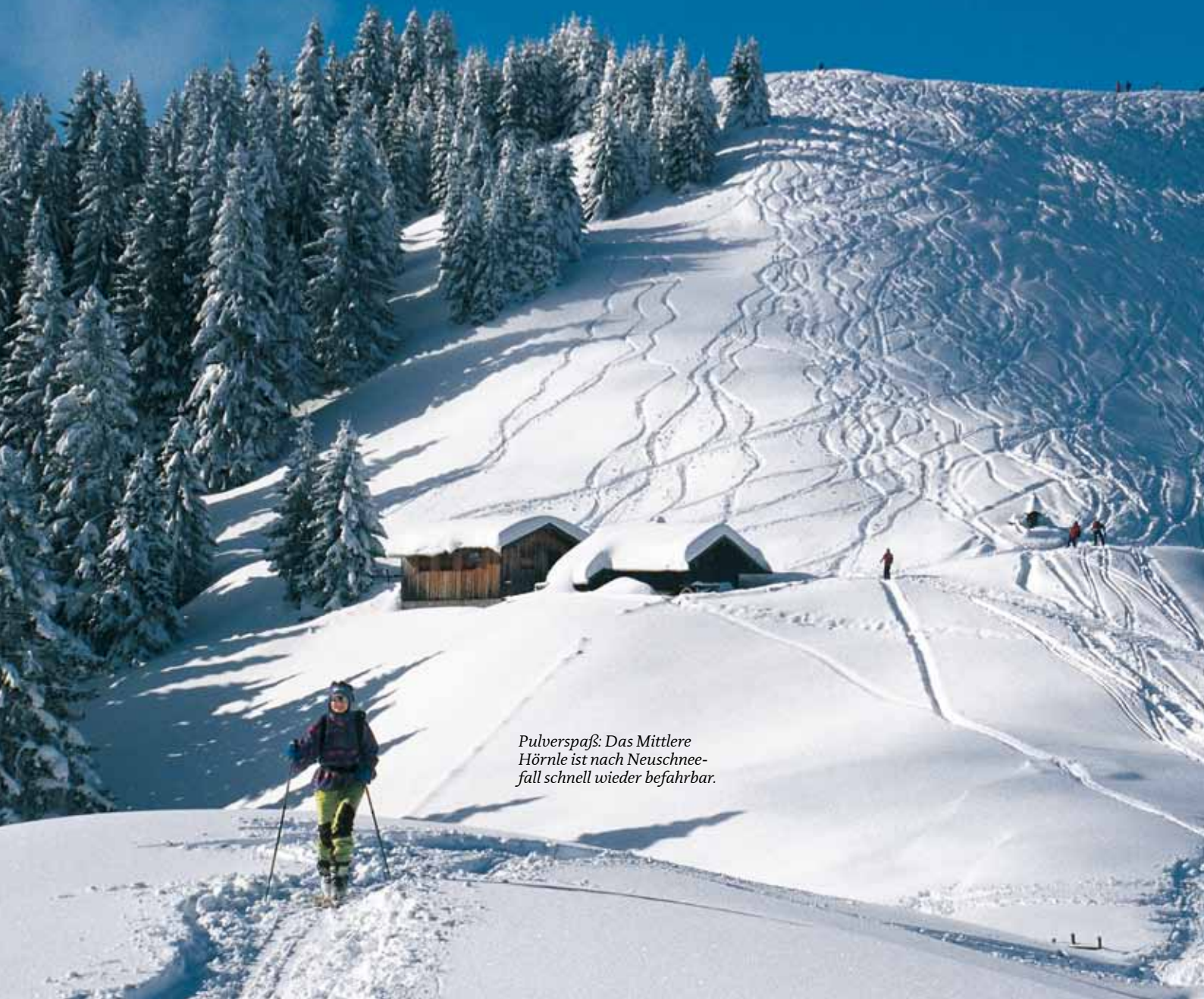
Pulverspaß: Das Mittlere Hörnle ist nach Neuschneefall schnell wieder befahrbar.

rer aus ökologisch sensiblen Bereichen fernzuhalten. Mit der Aktion „Skifahren und Natur schützen im Rotwandgebiet“ fing man 1986 an, 1999 wurde sie durch „Skibergsteigen umweltfreundlich“ abgelöst. Zwar halten sich inzwischen die meisten an die auf Freiwilligkeit basierenden Regeln, doch die Hartgesottene, die es partout nicht einsehen wollen und damit sogar behördliche Sperren provozieren, sind immer noch zu viele. Ab diesem Winter sieht ein hauptamtlicher Gebietsbetreuer des Landratsamts nach dem Rechten, hoffentlich hilft es.