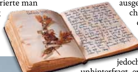
„Urlaub 1945!“ Aus dem tagebuchähnlichen Album eines Mädchens

unhinterfragt erhalten. Beispielfhaft ist der Gruß „Berg Heil!“ oder die heute sicher bekannteste und häufig gesungene Bergsteigerhymne „Wenn wir erklimmen schwindelnde Höhen“ („Bergvagabunden“), die 1945 entstand und „den Tod im Nacken“ besingt. Mit den Weltkriegen und dem Nationalsozialismus bekam selbst das Emblem des Alpenvereins einen bitteren Beigeschmack. Das Edelweiß wurde zur Lieblingsblume Adolf Hitlers stilisiert und war und ist Abzeichen der Gebirgsjäger, mit denen der Alpenverein eng zusammenarbeitete und sich sehr verbunden fühlte. Wie andere Wehrmachtseinheiten waren auch die Gebirgsjäger im Zweiten Weltkrieg an Kriegsverbrechen beteiligt. □