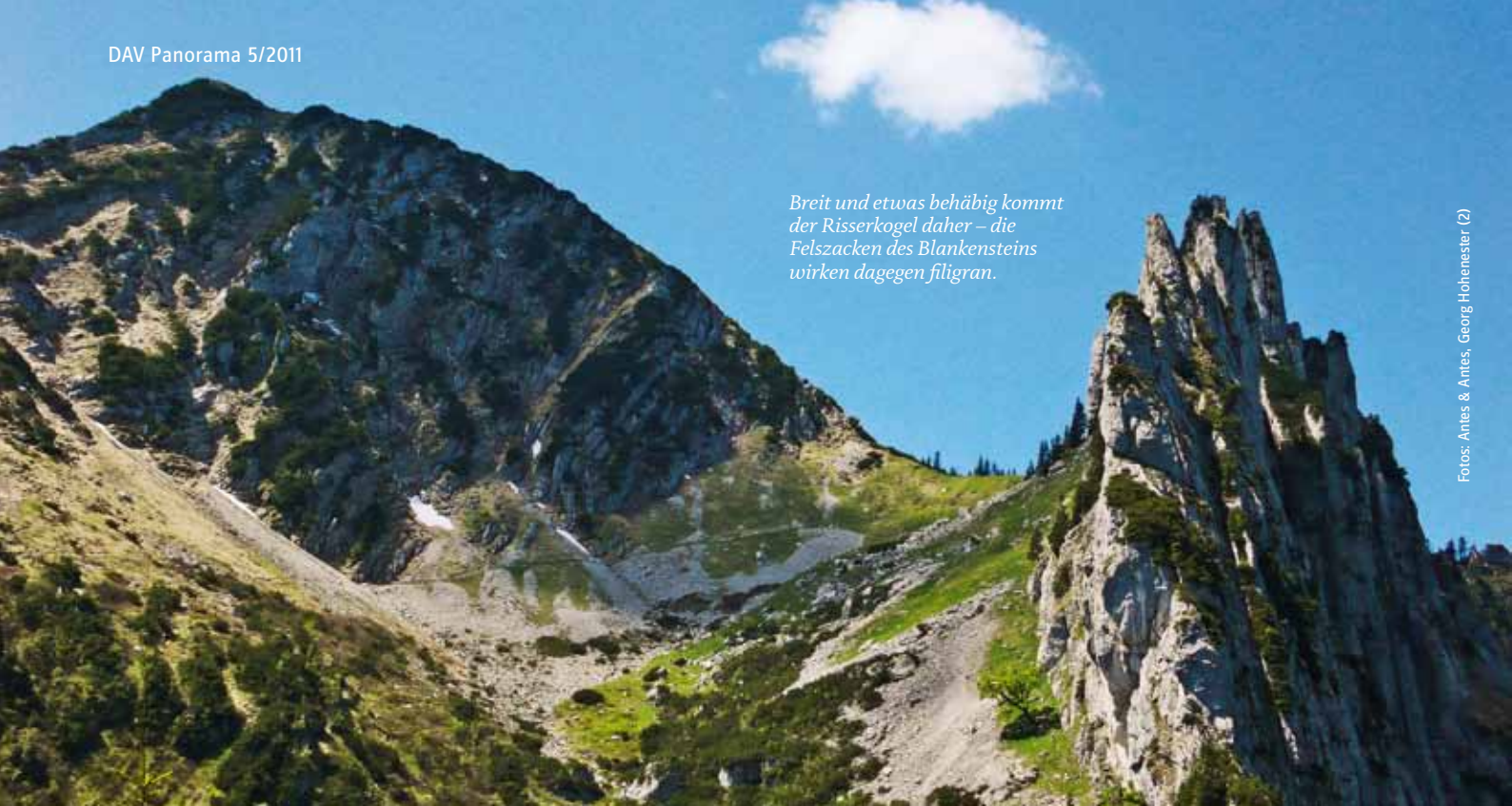
Breit und etwas behäbig kommt der Risserkogel daher – die Felszacken des Blankensteins wirken dagegen filigran.