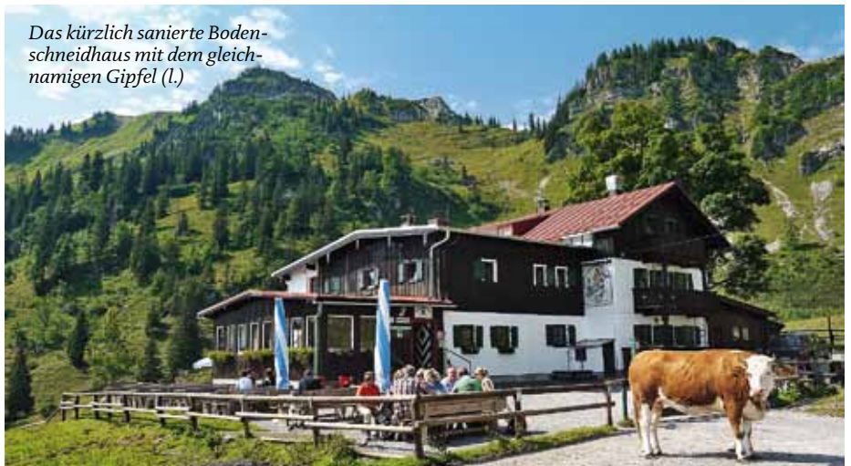
Das kürzlich sanierte Bodenschneidhaus mit dem gleichnamigen Gipfel (l.)

terwegs, der quer durch Bayerns Berge führt. Bevor man die Alm erreicht, zweigt rechts ein ausgetretener Pfad ab und führt über den lehmig-feuchten Hang zum breiten Gipfelrücken der Gindelalmschneid. Oben begeistert bei klarem Wetter die Ausblicke auf das Voralpenland von München bis zum Chiemgau. Richtung Osten geht es auch nach dem Abstieg zur Gindelalm weiter. Auf einer Forststraße ge-