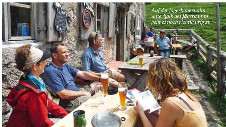
Auf der Jägerbauernalm unterhalb des Jägerkamps geht es noch richtig urig zu.

Die vorgeschlagene Dreitagestour lässt sich natürlich noch um Abstecher auf Hochmiesing und Aiplspitz erweitern. Und der Wendelstein, der so prominent herüberlacht? Der wäre in einem vierten Tag einzubinden. Nehmen Sie doch einmal eine AV-Karte zur Hand und planen Sie Ihre eigene Traumwanderung vom Tegernsee zum Schliersee. □