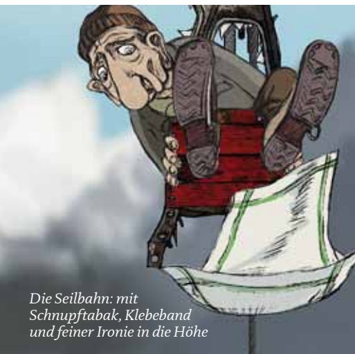
Die Seilbahn: mit Schnupftabak, Klebeband und feiner Ironie in die Höhe

lien (!) produzierte und der 2009 beim DAV-Abend auf dem Bergfilmfestival in Tegernsee lief. Er zeigt, wie Hugo die Uruca-Route klettert, eine der härtesten und begehrtesten Routen am Zuckerhut von Rio de Janeiro. Und dabei wird alles geboten, was einen Macho-Kletterer zur Verzweiflung und die Zuschauer zum Lachen bringen kann. Nicht den hehren Alpinismus, aber doch das Leben in den Schweizer Bergen nehmen die Schweizer Claudius Gentinetta und Frank Braun in ihrem Trickfilm „Die Seilbahn“ aufs Korn. Während der siebenminütigen Bergfahrt mit einer Älpler-Seilbahn, wie es sie nur in der Schweiz gibt (gab?), genehmigt sich der einzige Passagier, ein alter Mann, eine Prise Schnupftabak. Bei jeder Niesattacke löst sich die Kabine immer mehr in ihre Bestandteile