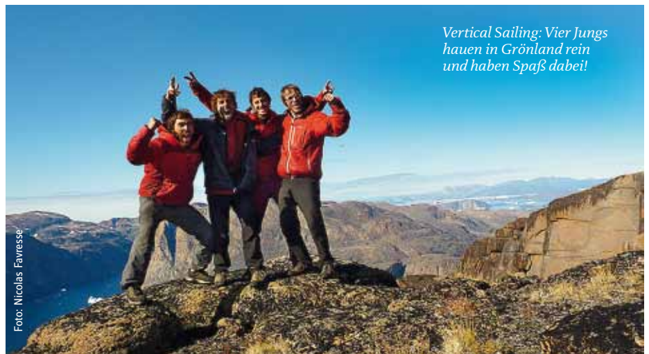
Vertical Sailing: Vier Jungs hauen in Grönland rein und haben Spaß dabei!

Wenn es schon im konventionellen Bergfilm wenig oder nichts zu lachen gibt, so ist wenigstens auf die Comic-Filmer Verlass. „Uruca“ oder „7°VIIIc E4“ lautet der Titel eines Zeichentrickfilms, den Erick Grigorovski in Brasi-