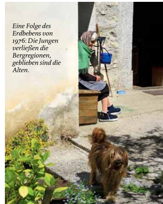
Eine Folge des Erdbebens von 1976: Die Jungen verließen die Bergregionen, geblieben sind die Alten.

Am nächsten Tag ersteigen wir den höchsten Berg der Region, den wuchtigen Monte Matajur. Eine schmale, gut markierte Wegspur zieht sich vom Rifugio Pelizzo durch Enzianwiesen aufwärts. Oben auf dem kleinen Gipfelplateau steht die italienische Kapelle, hinter der man die unsichtbare Grenze zu Slowenien überschreitet. Das Panorama vom Monte Matajur ist fantastisch. Gegenüber, auf der anderen Seite des tief eingeschnittenen Soca-Tals, reckt sich der Krn in den