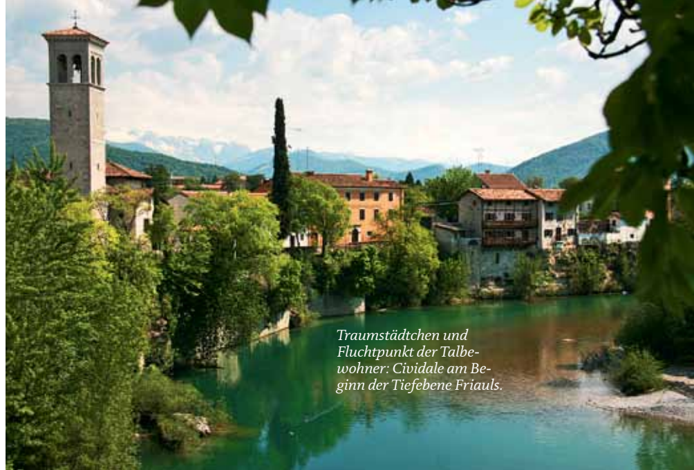
Traumstädtchen und Fluchtpunkt der Talbewohner: Cividale am Beginn der Tiefebene Friauls.

Die wichtigste Initiative zur touristischen Belegung kommt jedoch aus dem Ausland: Das Klagenfurter Universitätskulturzentrum „Unikum“ hat in den letzten Jahren immer wieder anspruchsvolle Reiseführer für touristische Fußgänger aufgelegt. Zuletzt waren die Kärntner Aktivisten im östlichen Friaul unterwegs, wo sie die attraktivsten Wanderwege suchten und Kontakte mit lokalen Kulturinitiativen knüpften. Publizistisches Ergebnis ist das Wanderlesebuch mit dem