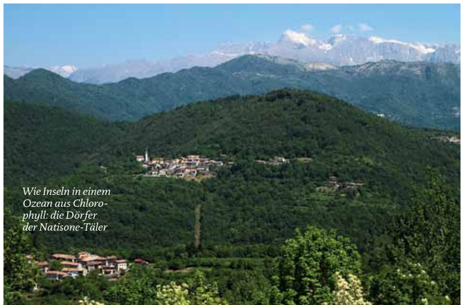
Wie Inseln in einem Ozean aus Chlorophyll: die Dörfer der Natisone-Täler

klassischen Reiserouten liegt. Zudem hatten die Bergdörfer durch das Erdbeben einen Teil ihres nostalgischen Reizes verloren. Weniger allerdings durch das tektonische Ereignis selbst