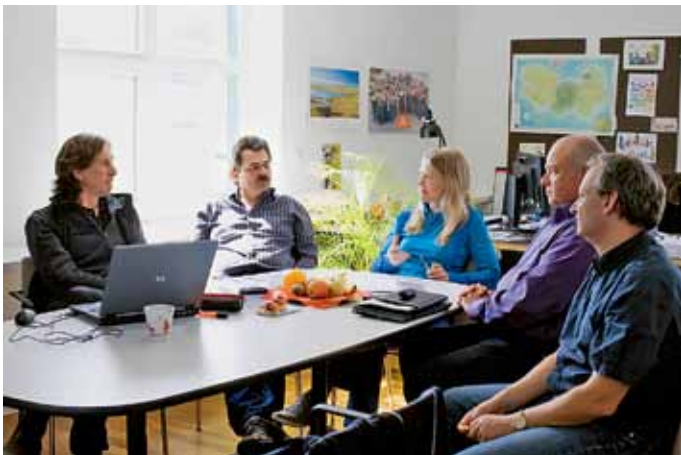
Eng getaktete Meetings mit den Führungskräften gehören zum Führungsstil.

Einmal durch mein gut strukturiertes Führungssystem. Wir investieren sehr viel in den Aufbau von Führungskräften, in die Übernahme von Eigenverantwortung, in Strategie und Zielprozesse. Dieses Grundprinzip muss funktionieren, damit ich rauskann. Ich habe mir zwei Nachmittage gesetzt, an denen ich versuche, um 17 Uhr zu gehen. Und natürlich durch eine gute Organisation zu Hause. Die Kinder sind hier noch im Kinderhaus oder teilweise im Hort, meine Mutter, meine Schwiegermutter, eine Haushaltshilfe unterstützen. Und mein Lebensgefährte arbeitet halbtags. Das ist wichtig. →