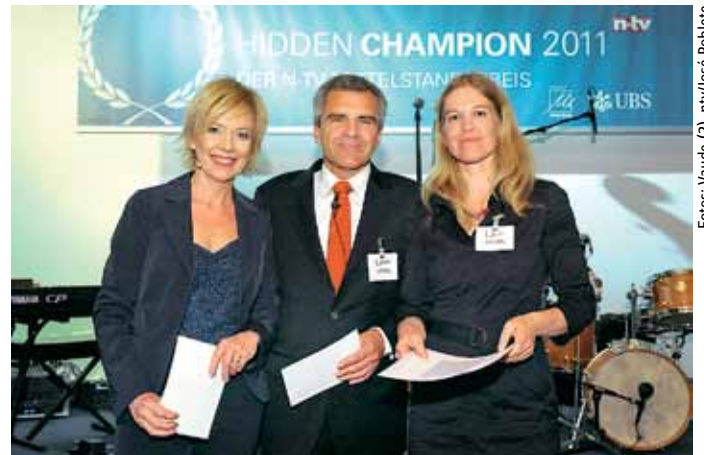
n-tv-Auszeichnung für den gelungenen Generationenwechsel bei Vaude