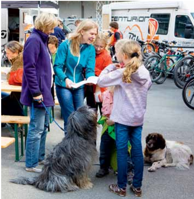
Verantwortung übernehmen heißt auch, soziale Belange berücksichtigen.