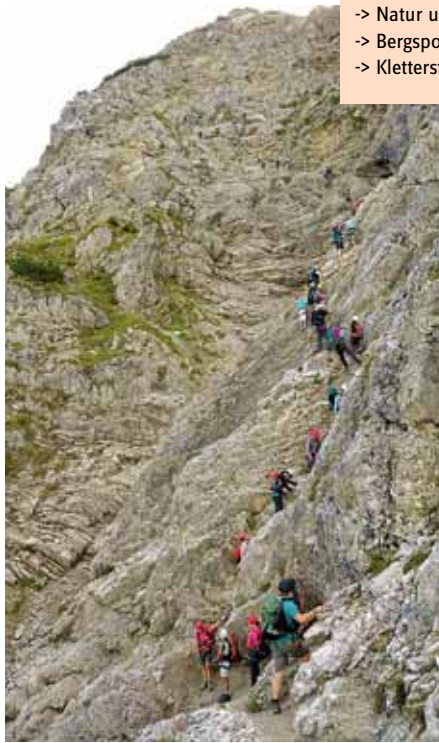
Nicht alle Klettersteige sind sinnvoll: Manche führen durch steinschlaggefährliche Schrofenflanken.

Den DAV-Kriterienkatalog für Klettersteige finden Sie unter www.alpenverein.de -> Natur und Umwelt -> Bergsport & Umwelt -> Klettersteige