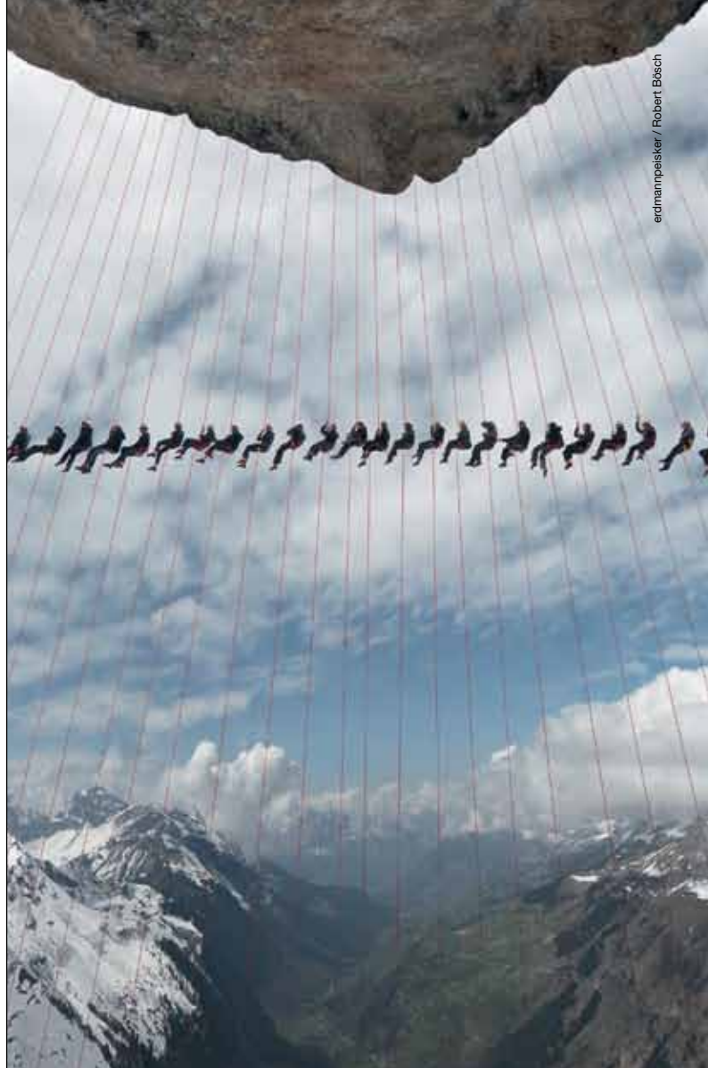
erdmannpelsker / Robert Bösch

Das Finale des Sportklettercups steigt Ende September in Darmstadt – hier werden auch die Tickets für die DM in Wuppertal Anfang Dezember vergeben. mk