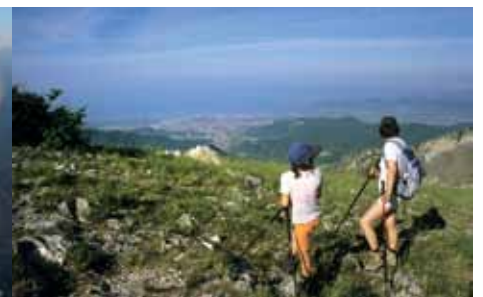
Berge weiß, Meer blau: Spannende Perspektiven bieten die Gipfel über der nördlichen Toskana.